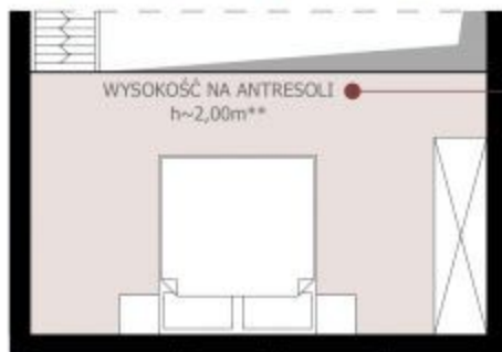
Rzut antresoli opcja*